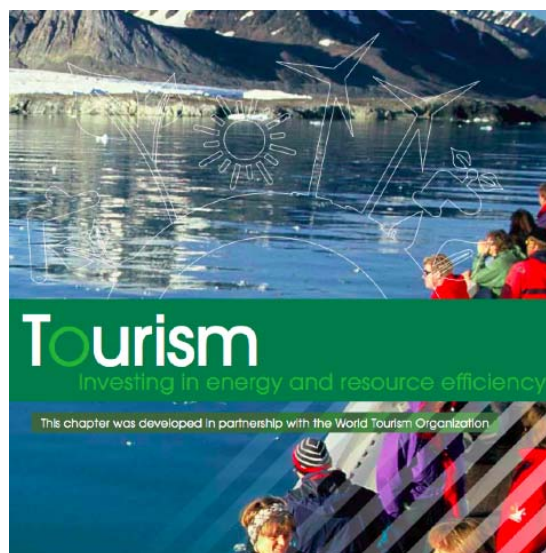
Investing in Energy and Resource Efficiency